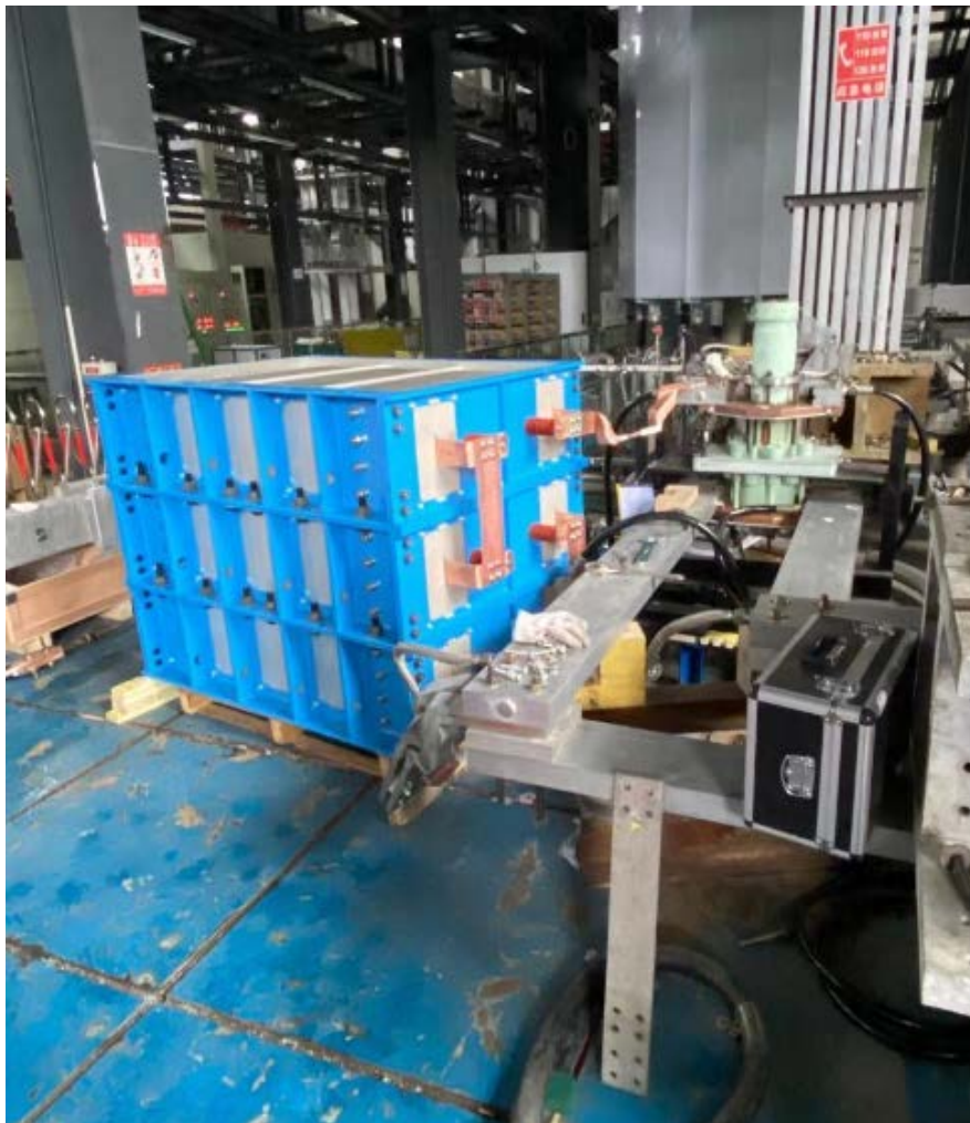
图 1 开关安装示意图